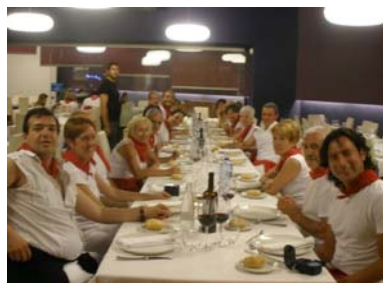
...durante la comida... formalitos, y después...