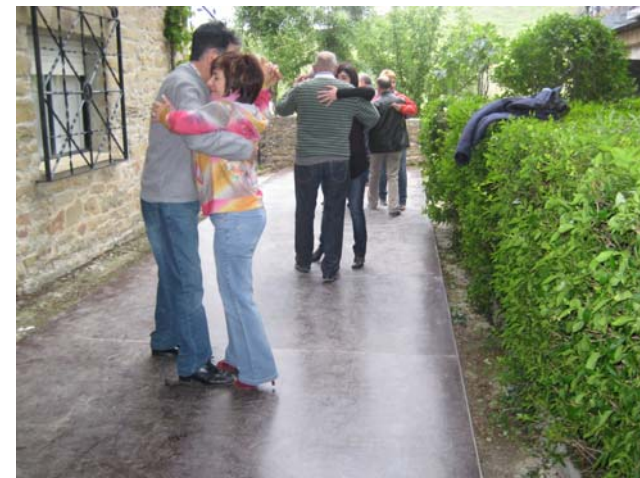
Lógicamente el tango no podía faltar.

La primera vez que se comenzó a usar el término Retango para denominar a los encuentros en Reta, coincidió precisamente con la inauguración de una pista de baile, que fue algo memorable. Consiguió reunir a unas ochenta personas, en una fiesta en la que todos participaban y disfrutaban con placer de cada rincón. Como no podía ser de otra manera, hubo almuerzo, comida y cena... y tango, mucho tango, además de charcaras, sevillanas y otros ritmos.