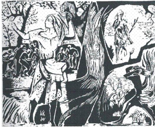
Grabado que representa la leyenda de la Telesita.