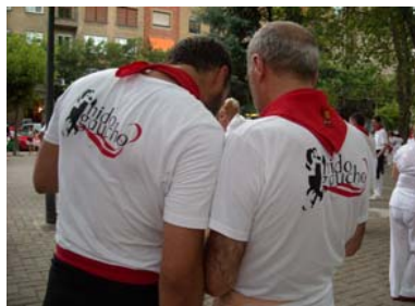
Salimos de casa guapos y estrenando camisetas...

“Pamplona, 8 de julio, bullicio y alegría, ya están los Nido Gaucho dispuestos a bailar. Con faja, pañuelico y las nuevas camisetas, con muy pocas “pesetas” la juerga va a empezar.”