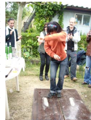
El flamenco también tuvo su lugar y se improvisó un tablao con lo primero que había a mano.

Este año, nos reunimos al día siguiente de la fiesta de aniversario.