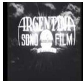
Argentina Sono Films, estudio cinematográfico fundado en 1933.

¡Tango! fue la primera película de la nueva sociedad fundada por entonces, la "Argentina Sono Film" y fue reconocida como el