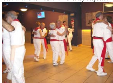
...pasamos a bailar del otro lado de bar....