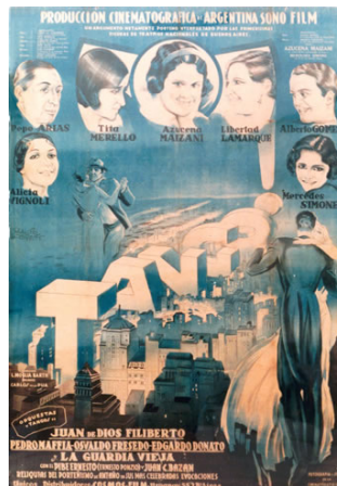
El cartel que anunció la película que se estrenó en el año 1933.