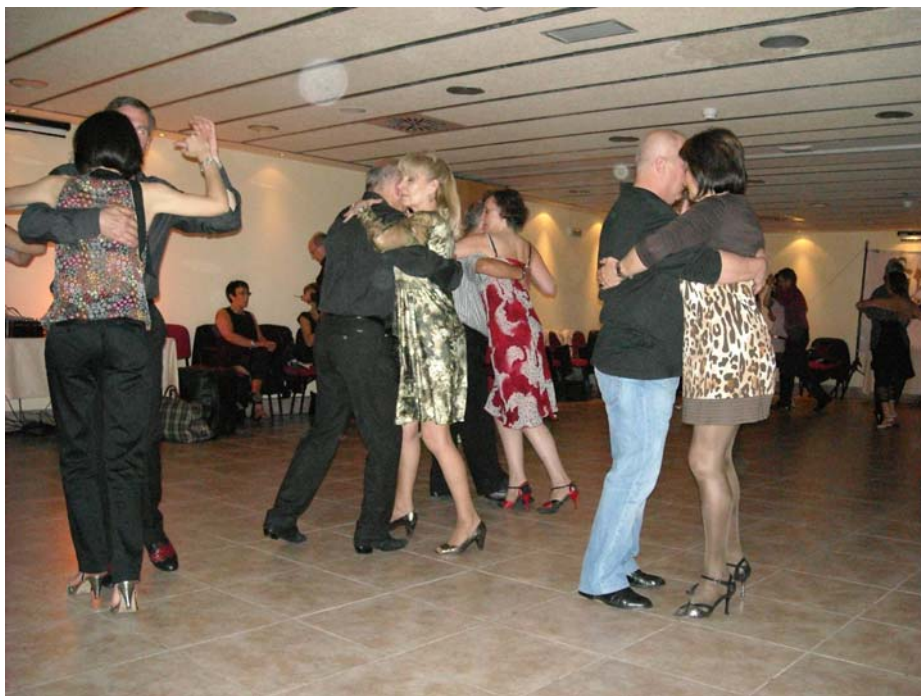
Un momento de la milonga de aniversario.