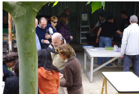
Aprovechando los momentos en que lucía el sol a la hora del almuerzo.

sario de Nido Gaucho. Asistieron por primera vez algunos amigos que nos habían acompañado el día anterior y que, sabiamente, decidieron quedarse. No sabemos si repetirán la experiencia, pero seguro que guardarán un buen recuerdo.