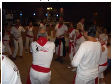
...comenzamos bailando en el comedor...