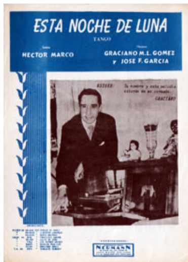
Portada de la partitura.

Acércate a mí y oirás mi corazón contento latir como un brujo reloj. La noche es azul, convida a soñar, ya el cielo ha encendido su faro mejor. Si un beso te doy, pecado no ha de ser; culpable es la noche que incita a querer. Me tienta el amor, acércate ya, que el credo de un sueño nos revivirá.