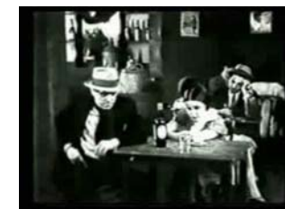
Una escena de la película.

La repercusión de la película fue tal que le dio al cine argentino la posibilidad de obtener ganancias importantes y competir en el negocio. Por muchos años el tango sería la fórmula mágica que abri-