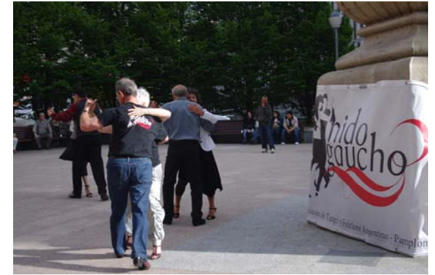
Milonguita de la tarde en la plaza del Vínculo.

La fiesta comenzó a media tarde. Nos reunimos en la plaza del Vínculo y tras desplegar nuestra pancarta y una vez conquistado el lugar, encendimos nuestro equipo y disparamos la música dando comienzo a una milonguita al aire libre tal y co-