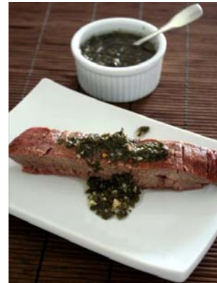
El chimichurri es el aderezo más comúnmente utilizado.

En el número anterior, hemos hablado del asado y de las distintas técnicas para hacerlo.