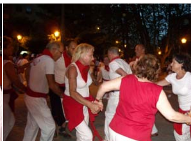
...y al anochecer... ¡bailando sin parar!