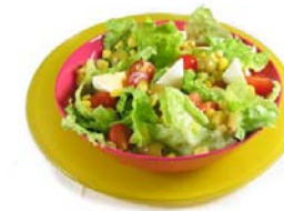
Una buena ensalada, acompañamiento ideal.

ciones, se pueden utilizar: salsa golf; ketchup; pan blanco; pan de salvado; pimienta; limón; salsa de soja; aceite de oliva; mayonesa; orégano; aceite de maíz; vinagre; pimentón; aceite de oliva, aceto balsámico, aceite de girasol, etc.