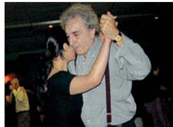
La mayoría son setentones, les cubre la cabeza "el zorro plateado".

A los trece años, cuando el rito de iniciación viril de entonces, "ponerse los largos", los convertía en aprendices de hombres, los amigos mayores los llevaban a la milonga. No había en esa época clases de tango en algún Centro Cultural. La idea misma del centro cultural les hubiera resultado mariconada. Iban a lugares , donde cada dos por tres caía la cana en un procedimiento de rutina. Y ahí, a los trece o catorce años tenían que mirar a los que bailaban para descubrir el arcano de esa danza cuyo dominio les prometía el dominio del mundo. Des-