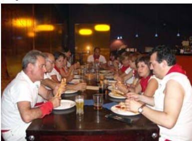
...cargamos las pilas con la cena...