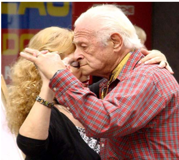
Ahí estaban estos juramentados que nada podían hacer sino seguir bailando, noche tras noche.