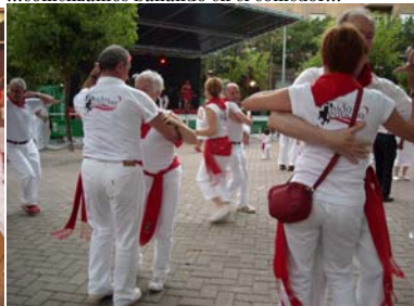
... salimos a bailar en la calle...